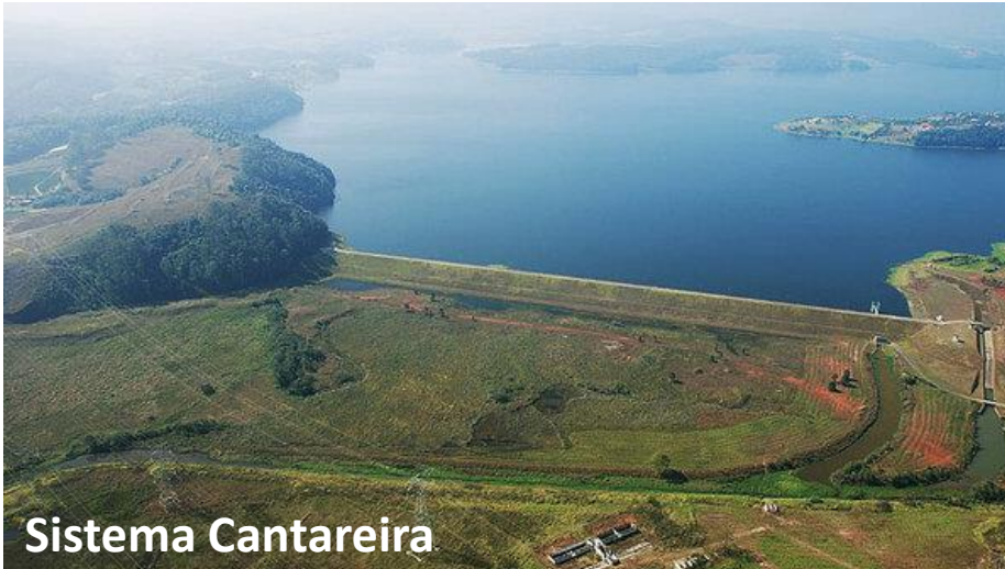
Sistema Cantareira Sistema Cantareira