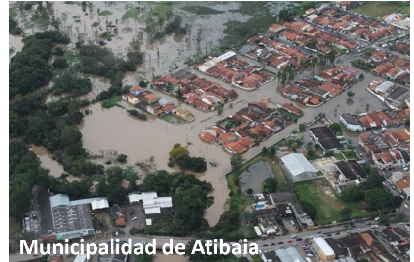
Municipalidad de Atibaia Municipalidad de Piracicaba