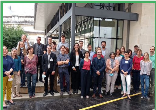
Les partenaires du projet lors de l'assemblée générale de septembre 2021 à Limoges.

Responsable de Projets - Innovation Eau, OiEau Coordinatrice du projet LIFE Eau&Climat